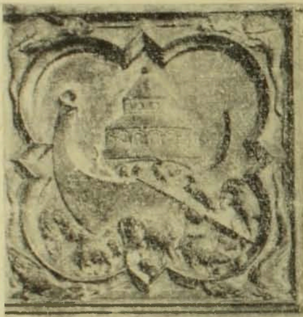
Սենտ-Շապելի հարթաքանդակներից մեկը:

Եկեղեցու արևմտյան ճակատի երկրորդ հարկի շքամուտքը հայ արվեստագետների ուշադրությունը գրավեց և բանավեճեր առաջացրեց 1950-ական թթ. վերջին և 1960-ական թթ. սկզբին: Բանավեճերի առարկա